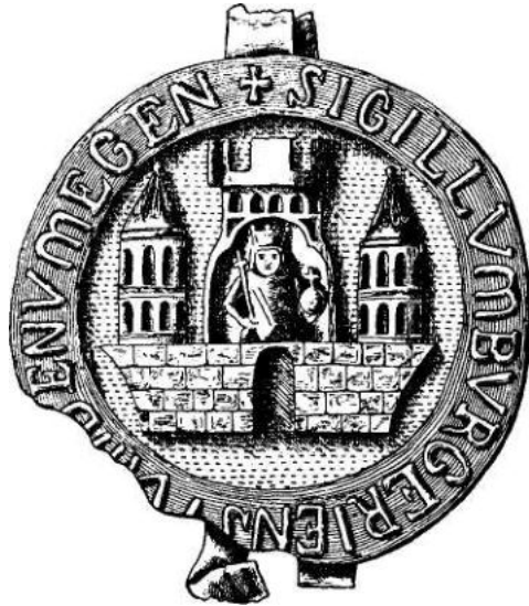
Afdruk uit 1271 van het Nijmeegse stadszegel, (fotocoll. gemeentearchief, foto: Theo Hendriks)